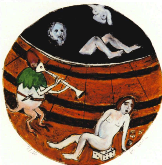
Variations sur Hieronymus B. 2014 - Gravure au carborandum réhaussée à la main, série de 23, 25 x 25 cm - Editions PASNIC