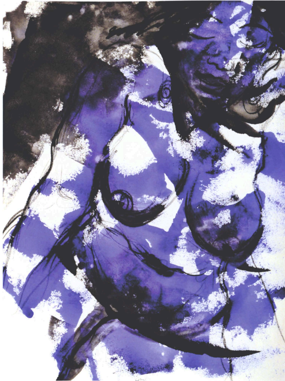
femme africaine . 2012 - Technique mixte sur toile, 65 x 50 cm