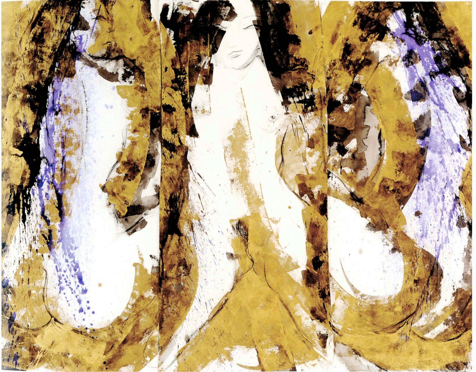
femme japonaise. 2012 - Triptyque, technique mixte sur toile, 125 x 160 cm