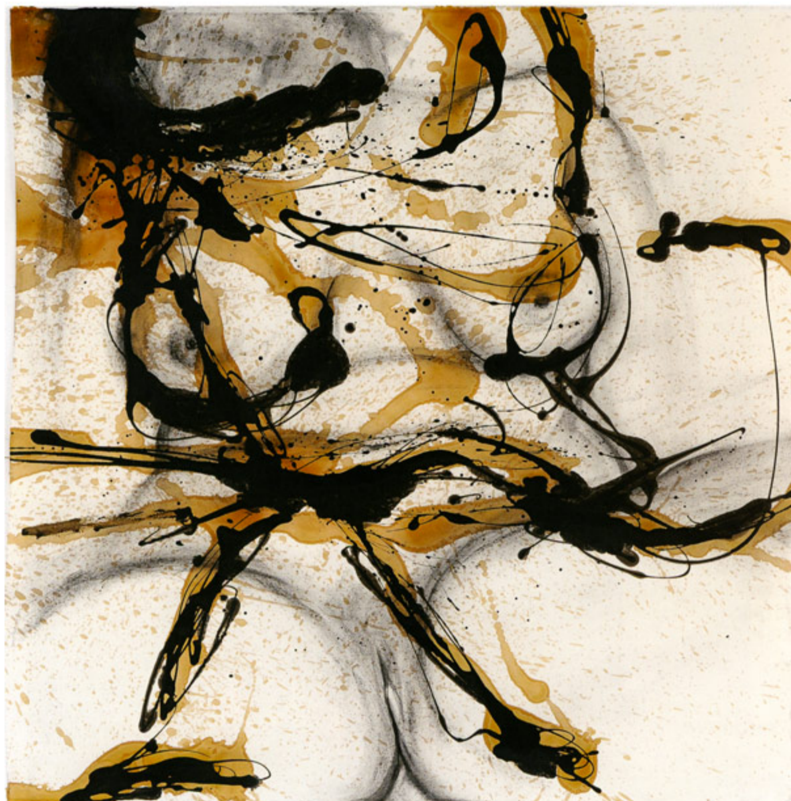
« Femmes Blanches I » - technique mixte sur papier - (125 x 125 cm) - 2011