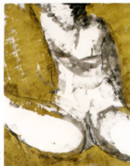
« Femmes Asiatiques I » - technique mixte sur papier - (125 x 125 cm) - 2011