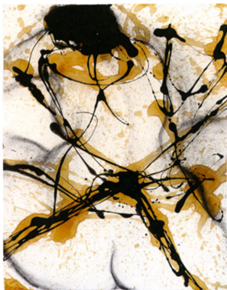
« Femmes Blanches II » - technique mixte sur papier - (125 x 90 cm) - 2011

Tél. : 00 33 (0)6 89 85 38 44 sophie@sophiesainrapt.com www.sophiesainrapt.com