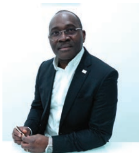
Génération Covid de Jean-Célestin Edjangué Edition l'Harmattan Guinée 14€50

Le Covid-19 a percuté de plein fouet les jeunes générations, remettant au grand jour la situation peu enviable d'une jeunesse déjà fragilisée par le contexte socio-économique, politique, environnemental et même digital ambiant avec la fracture numérique, confirmant la vulnérabilité des jeunes, dans le monde entier, la précarité de leur vie quotidienne. En temps de paix comme de guerre, pendant les périodes de crises politique, économique, sociale, climatique ou sanitaire, comme depuis fin 2019, les jeunes, au même titre que les femmes, les enfants, les personnes beaucoup plus âgées ou handicapées, sont des proies faciles d'une conjoncture qu'ils n'ont vraiment pas choisie. Cette contribution, fruit d'une enquête menée avec des jeunes d'Afrique, Europe et des Etats-Unis d'Amérique, en janvier 2021, nous montre comment ces générations nouvelles ont su, face à cette crise inédite, trouver des mécanismes, souvent originaux, pour continuer à élaborer des projets et envisager des lendemains meilleurs.